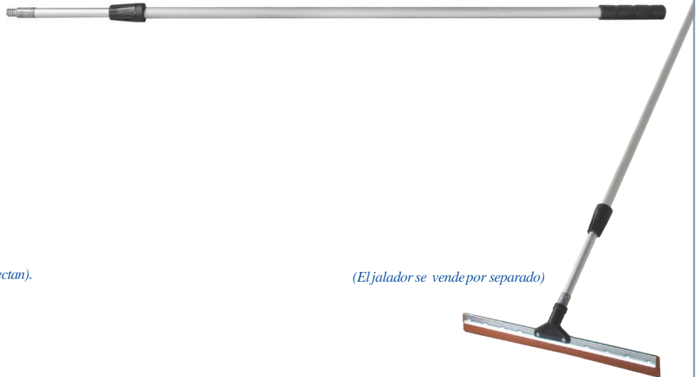
(El jalador se vende por separado)